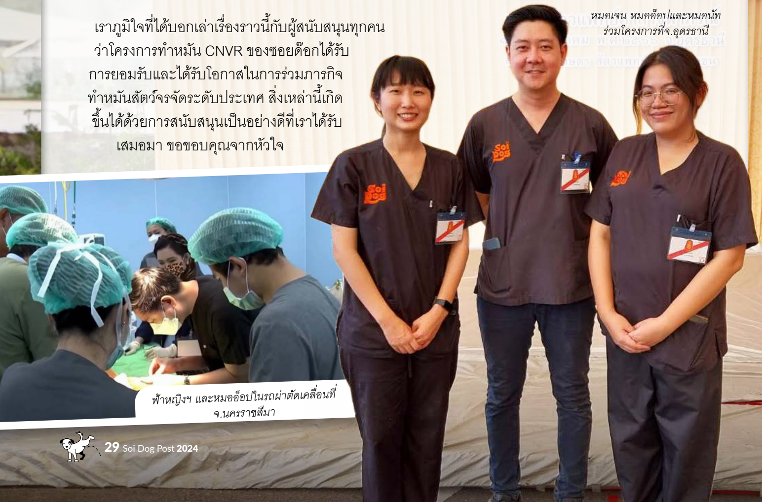
ฟ้าหญิงฯ และหมอมอ้อปในรถผ่าตัดเคลื่อนที่ จ.นครราชสีมา

หมอมเจน หมอมอ้อปและหมอนัท ร่วมโครงการที่จ.อุดรธานี