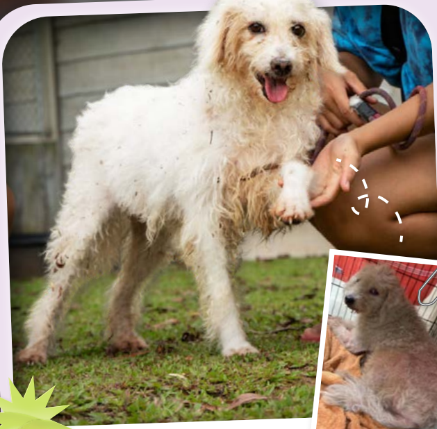
อายุ: 9 ปี 5 เดือน | เพศ: เมีย